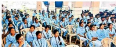
సదస్సుకు హాజరైన విద్యార్థులు